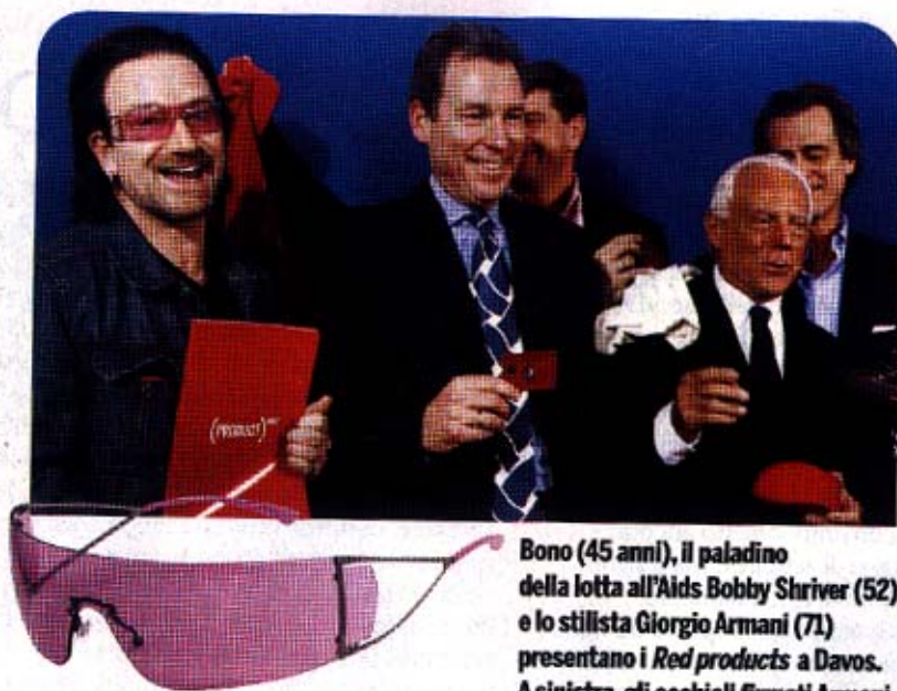
Bono (45 anni), il paladino della lotta all'Aids Bobby Shriver (52) e lo stilista Giorgio Armani (71) presentano i Red products a Davos. A sinistra, gli occhiali firmati Armani.

auspicano che il prossimo governo del nostro Paese faccia fronte più seriamente che in passato agli impegni presi nel campo della solidarietà. In attesa dei soldi dai Paesi più ricchi, però, la rockstar continua la raccolta di fondi per le sue campagne. La sua più recente iniziativa, presentata al summit economico di Davos, in Svizzera, si chiama Red products e coinvolge, oltre a società come American Express, Converse e Gap, anche Giorgio Armani : lo stilista ha creato per Global Fund , un'organizzazione nata quattro anni fa con l'obiettivo di combattere la diffusione di Aids, tubercolosi e malaria, una linea di occhiali avvolgenti, con montatura di metallo